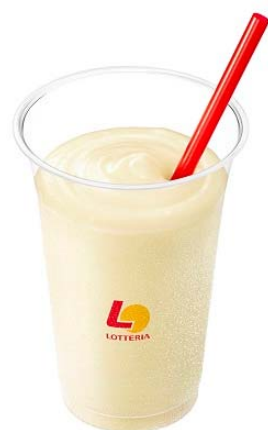
商品名:『ロッテリア シェーキ』※2 価格:199円(通常価格264円)