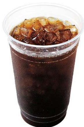
商品名:『メガアイスコーヒー』 価格:299円(通常価格320円)