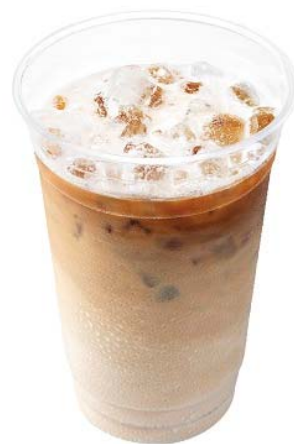
商品名:『メガアイスカフェラテ』 価格:299円(通常価格350円)