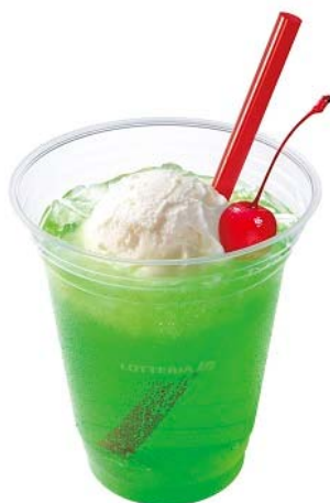
商品名:『クリームソーダ』 価格:299円(通常価格390円)