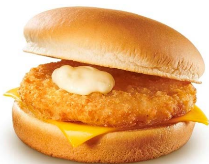
商品名:『チキンチーズバーガー』 価格:199円(通常価格264円)