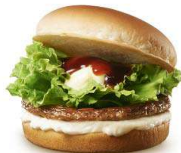
商品名:『とろ〜り北海道チーズ & てりやきバーガー』