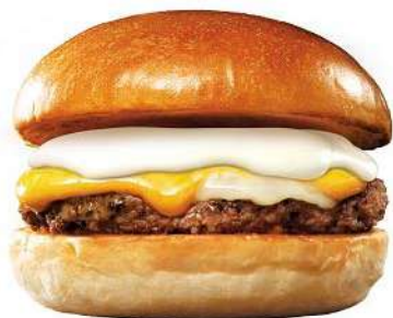
商品名:『とろ〜り北海道チーズ & 絶品チーズバーガー』