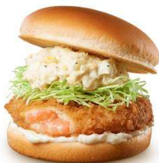
商品名:『とろ〜り北海道チーズ & エビバーガー』